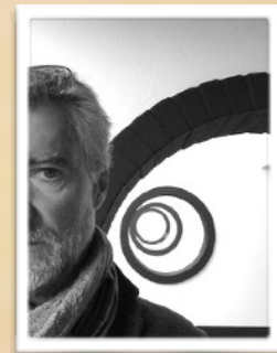
Olivier LEGUISTIN Coordination, réalisation