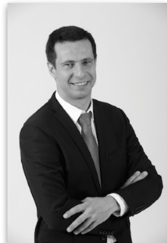
Par Julien FORGET Avocat associé Cabinet TERRESA membre-fondateur du réseau AGIRAGRI